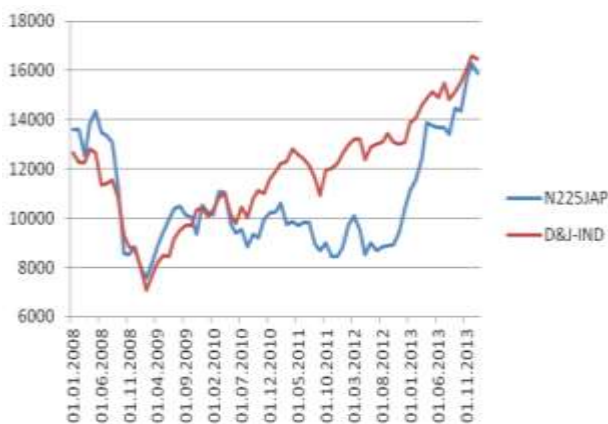
Рис. 2. Динамика фондовых индексов США и Японии в период 2008–2014 гг. [5]

Положительная динамика основного экспортного продукта повлияла на рост экономики страны и привлекательность ценных бумаг для внутренних и иностранных инвесторов [4], однако 2012 и 2013 гг. выбились из общей тенденции – стабильные цены на нефть больше не позволяли расти экономике страны и соответственно фондовому рынку, который по настоящее время не может восстановиться к уровням 2008 г., хотя фондовые рынки развитых стран превысили показатели докризисного периода (рис. 2).